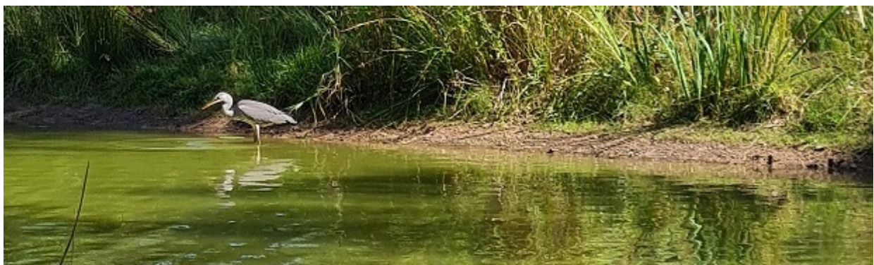
Korbposition und Stammgast am Teich der Bahn 7